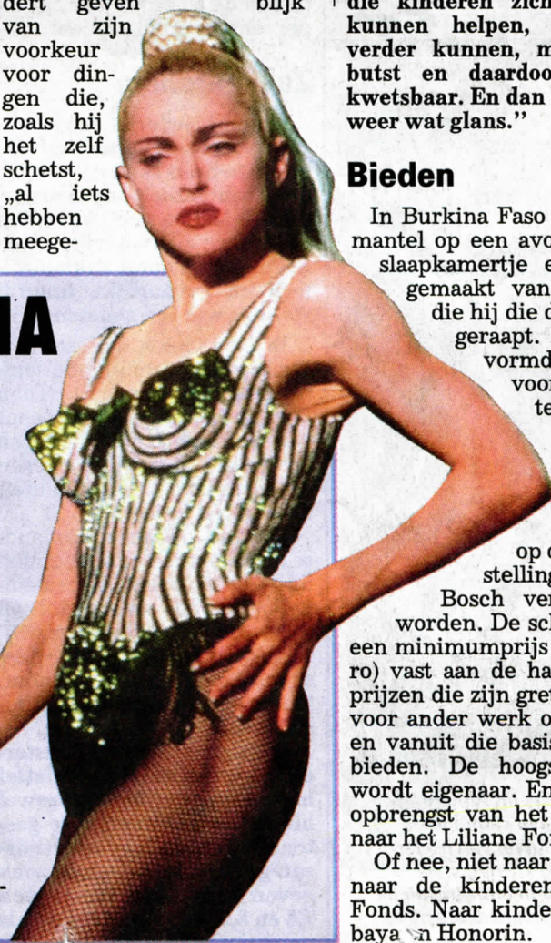
■ Madonna in de beroemde bus- tier van Gaultier tijdens haar vori- ge tournee.

schoenen zijn van Europese makelij. Naast Jimmy Choo en Miu Miu liet ze zes paar knielange Yves Saint Laurent-larzen maken, naar een voorbeeld van een oud paar van alweer een paar seizoenen geleden.