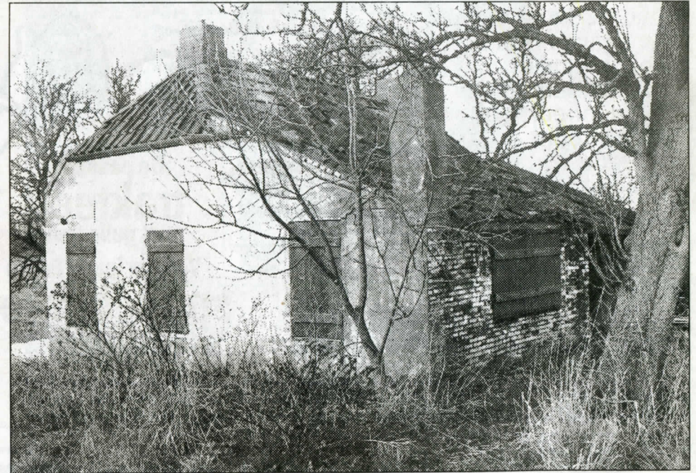
LEENS - oktober 1989. Jarenlang heeft dit woninkje het Huisje Noosten geheten, naar de laatste eigenaar. De voormalige Vereniging Ommelander Museum voor Landbouw en Ambacht kocht het gebouwtje, knapte het op, gaf het een museale bestemming en doopte het om tot 't Hoeske.

Bim-bam Pendules, Koekoekklokken, moderne Wandklokken, Wekkers, Fantasie- en Reiswekkertjes, FOTOTOESTELLEN, Tassen, Films, Zonnebrillen en Voorhangers. GERO-artikelen, Cassettes in 16-, 28- en 41-delig in verschillende modellen voorradig. — Zilv. en verz. Toren- en Wapenlepels Eenrum, Bafo en Kloosterburen Wed. ADR. LEEUWE, Horlogerie, Tel. 45, Eenrum