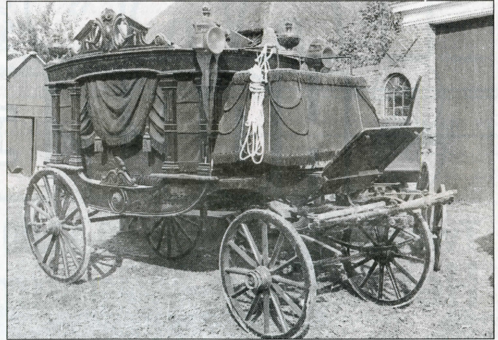
LEENS - september 1985. Al wordt de lijckoets van Leens niet meer gebruikt, zo nu en dan kan men deze toch bekijken. Tijdens de Leenster Dag stond de koets in vol ornaat tentoongesteld.