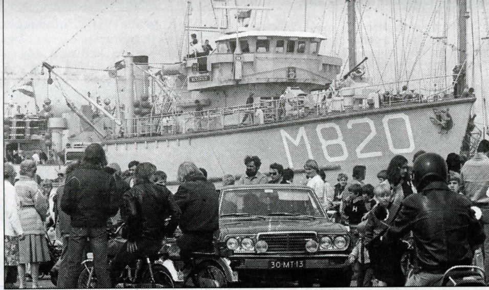
LAUWERSOOG - mei 1981. Open Dag Lauwersoog. Een schip van de Nederlandse Marine in de haven trekt altijd veel belangstelling. Zeker als je ook nog aan boord mag...

eiken. Ceta-flex houtlijm Wasbijs, Velpon, Snelpon, Plasticlijm, Buienbijs, Fa. L. Vast, Tel 23, Leens