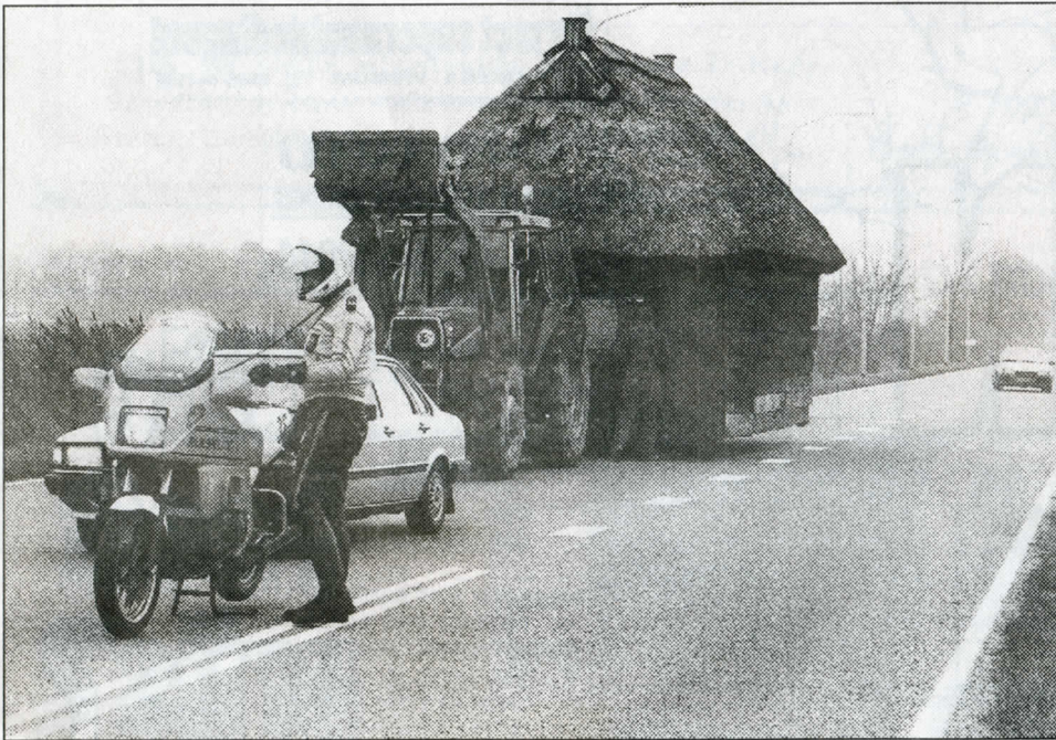
EENRUM/LEENS - november 1990. Speciaal transport. Onder politiebegeleiding werd een authentieke loophut van Eenrum naar Verhildersum in Leens overgebracht. Het vee op het landgoed maakt er dankbaar gebruik van.