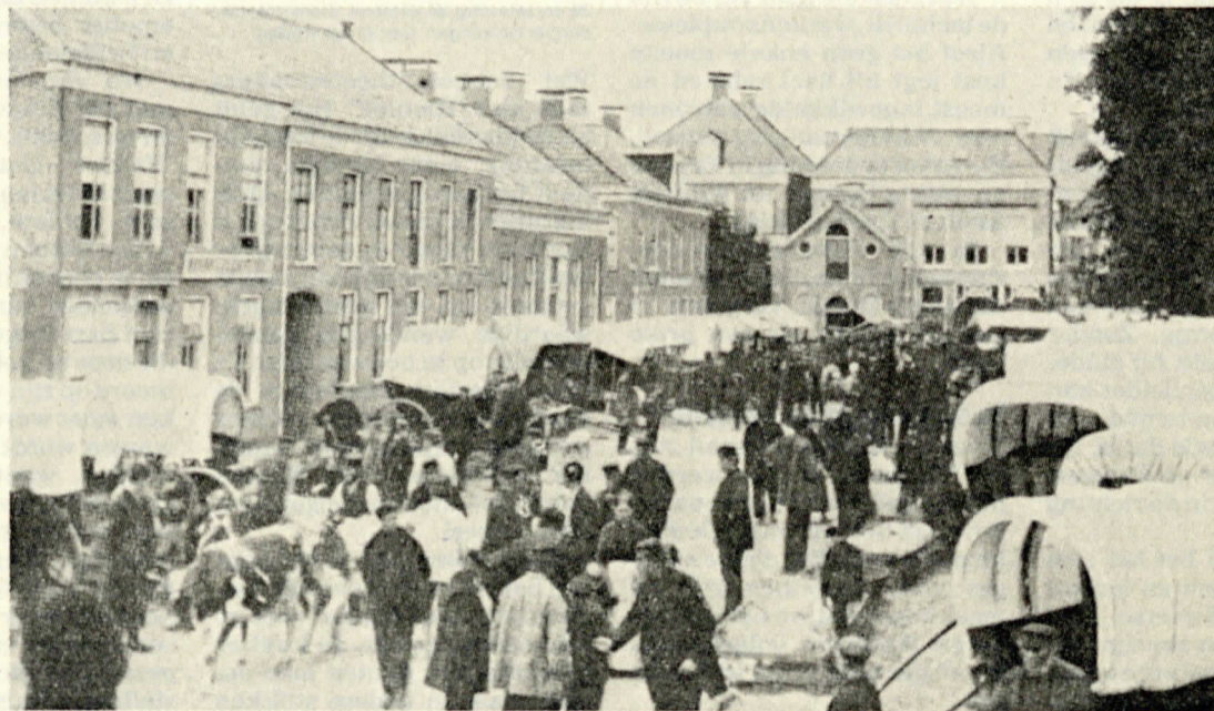
▲ Zo ging het er in die goede oude tijd aan toe op de Winschoter markt. Let op de prachtige huifkarren.

Zo'n anderhalve eeuw geleden kwamen de meesten op die eerste maandag in november te voet. Voor dag en dauw gingen ze vanuit hun dorp op pad, dik ingepakt tegen de kou. Vervolgens kregen ze te maken met erbarmelijk slechte wegen. In de zomer zandwoestijnen, in de herfst en winter modderpoelen. Winschoten lag geïsoleerd en dat paste een handelscentrum niet. Het gemeentebestuur begon rond 1840 dan ook iets aan die toestand te doen. Er gingen vele jaren overheen, maar uiteindelijk werden de wegen naar de omliggende dorpen verhard. Ook de hoofdverbindingen naar Bourtange en Nieuweschans kregen een beurt. Nadeel voor de reizigers bleef wel de tolheffing. Scheemder bezoekers aan Adrillen dienden enige tijd een som te