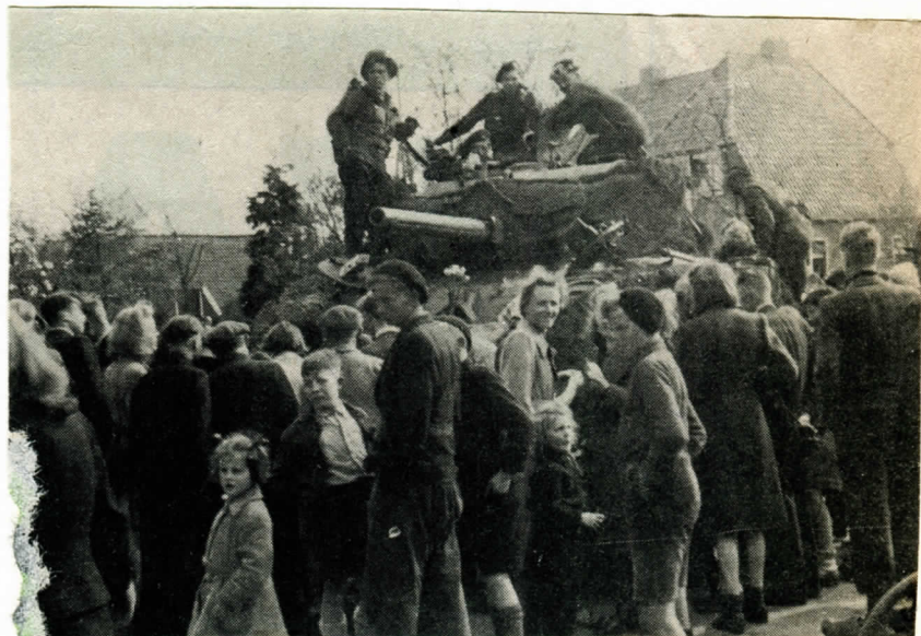
Haren, 14 april 1945. De bevrijding is een feit. Een Firefly op de Middelhorsterweg.

Huizinga heeft het boek zo geschreven dat het zich geboeid laat lezen, waarbij het voor een deel unieke fotomateriaal ook zeker velen zal aanspreken. In het boek zijn trouwens ook gedeelten verwerkt van de Canadese stafkaart, zoals die destijds door de Canadezen werd gebruikt. Verder zijn een aantal door de Royal Air Force gemaakte luchtfoto's van verdedigingswerken van o.a. Gro-