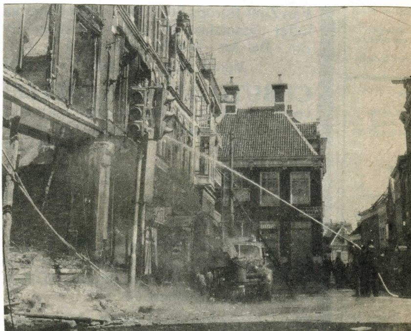
De Poelestraat op maandagmiddag 16 april 1945. Even na het middaguur. De Duitse garnizoenscommandant heeft zich aan de Canadezen overgegeven. De brandweer blust de branden. De auto is een Duitse wagen. Let u op de gasgenerator voorop.