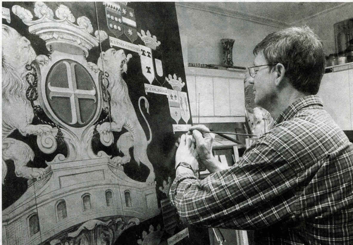
Restaureren is poetsen, boenen en nauwkeurig bijschilderen.

De rouwborden horen thuis in het kerkje van Wittewierum, maar zijn voor een grote onderhoudsbeurt naar Beerta gebracht. De borden verkeren, in vergelijking met andere rouwborden in redelijke staat. De borden van het echtpaar Rengers hebben een staatsgreep ten tijde van Napoleon overleefd. In de Bataafse periode waarin alles dat het verschil tussen arm en rijk zichtbaar maakte moest verdwijnen, zoals de rouwborden van edelen, is veel verloren gegaan. Na de val van Napoleon en het herstel van Neerlands onafhankelijkheid werden de rouwborden, voor zover nog aanwezig, naar hun oorspronkelijke plaatsen in de kerken teruggebracht. Dat terugplaatsen heeft bij de rouwborden van het echtpaar Rengers tot gevolg gehad dat de bekroning van het ene rouwbord is verwisseld met dat van het andere. Hierdoor zijn delen van de sterfdata veranderd. Dat zich daar nooit iemand druk over heeft gemaakt is niet zo verwonderlijk. Men was allang blij dat de borden niet waren stukgeslagen of gebruikt als afscheiding van varkenshokken hetgeen niet ongebruikelijk was in de Bataafse periode.