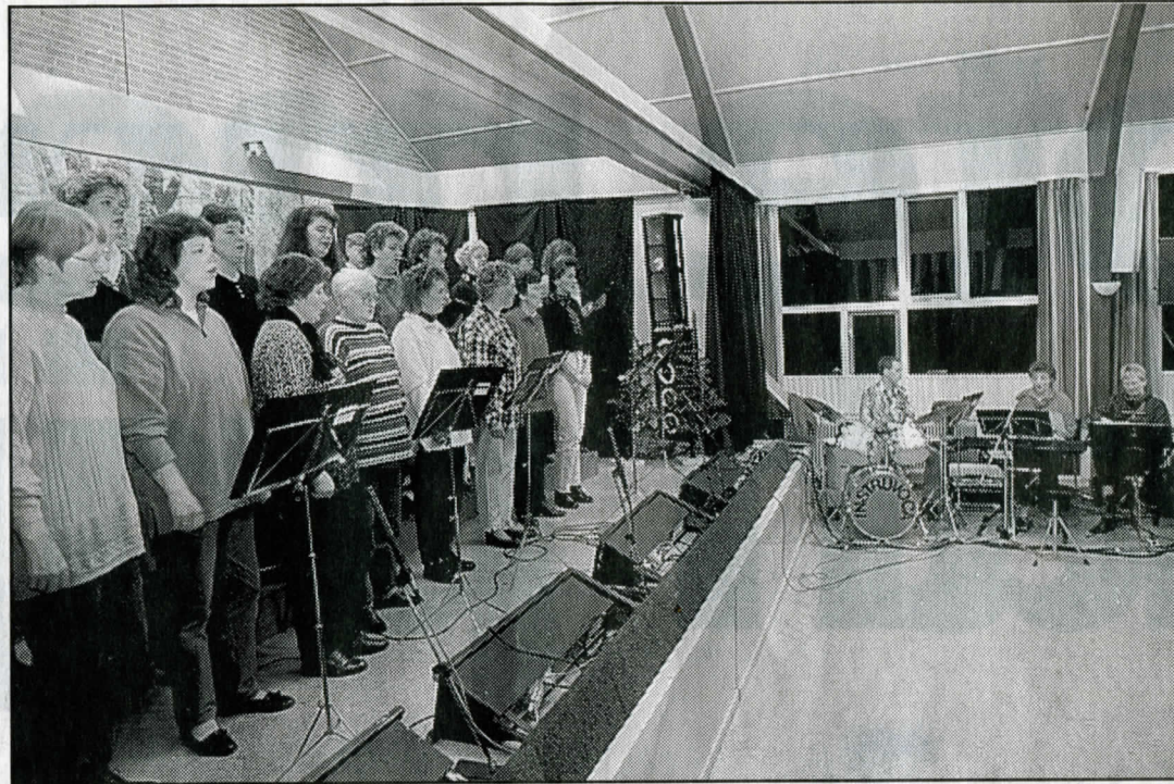
▲ Instru-Voca in actie tijdens de laatste repetitie.