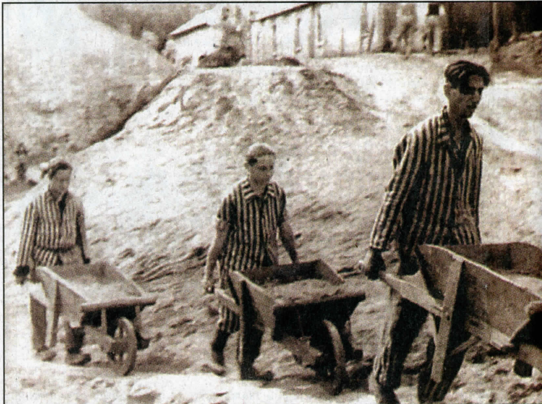
▲ „Het onderbrengen van joden in werkkampen was een meesterzet.”