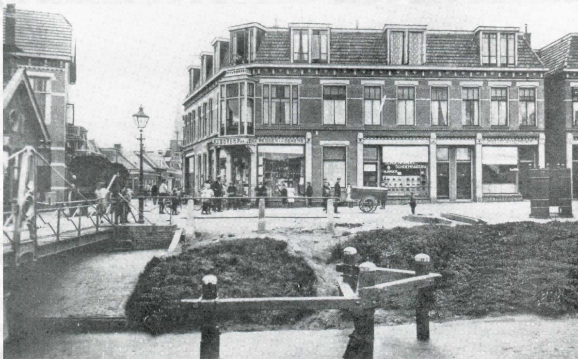
Uiterst rechts in het rechterpand de zaak van de 'volksslager' Simon de Vries