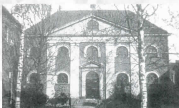
Boschstraat met synagoge