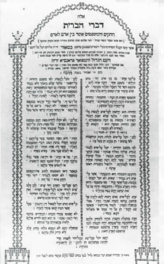
De rechten van de mens en burger in het Hebreeuws