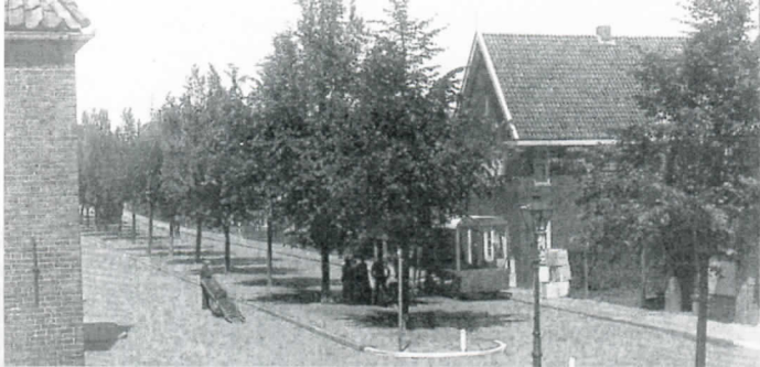
Een woning van een joods gezin wordt leeggehaald

op joodse rovers. Toen rond 1770 in Holland de druk van de justitiële autoriteiten op de daar opererende bendes toenam, voelden sommige bendeleden zich genoopt naar een veiliger plaats uit te zien. In Winschoten en omgeving had een aantal van hen familieleden. Het is aannemelijk dat zij erop vertrouwden dat deze verwanten hen niet zouden aangeven bij het gerecht.