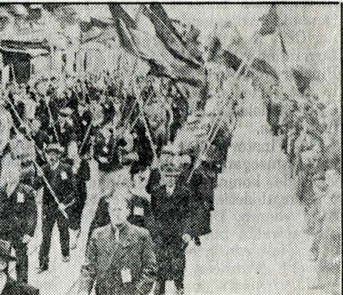
optocht in 1938 in de stad Groningen, met vlaggen, want socialisten waren vaak geuit „Groningen in oude ansichten, deel 2"

Regelmatig krijgt de Geschiedeniswinkel aanvragen die betrekking hebben op onderzoek in de regio's Drenthe en Groningen.