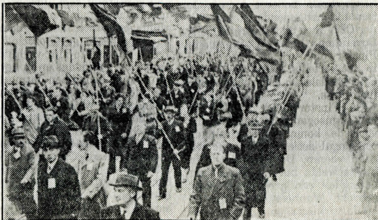
Een massale 1 mei-optocht in 1938 in de stad Groningen, met veel rode en blauwe vlaggen, want socialisten waren vaak geheelonthouders. (Foto uit „Groningen in oude ansichten, deel 2” van G. W. Kattenbeld.

De oudste Nederlandse drankbestrijdersvereniging was de „Nederlandse Vereniging tot Afschaffing van Sterke Drank”. Ze werd in 1842 opgericht. De leden waren voornamelijk „heren” uit de hogere burgerij: artsen, predikanten en rechtsgeleerden. Drankbestrijding was voor hen een vorm van filantropie, gebaseerd op christelijke - en zedelijke beginselen. Zij richtten hun aandacht op de jeneverdrinkende „volksklasse”. In 1843 werd er