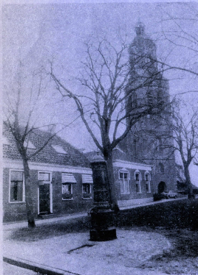
Hervormde 13de-eeuwse kerktoren en dorpspomp in Eerum.