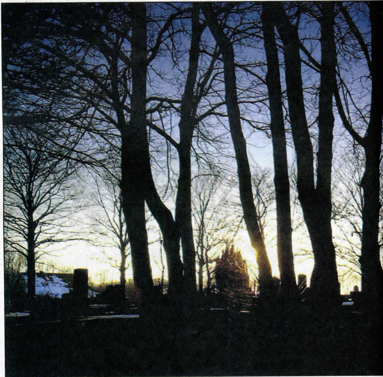
▲ Het kerkhof van Zuidwolde ligt er sinds kort weer piekfijn bij.

„Het is een plek waar in de loop der jaren veel is afgeknabbeld”, vertelt stichtingvoorzitter H. de Olde. Zo moest er toen er langs de kerk een weg werd aangelegd een deel van het gebouw dat uit de 13e eeuw stamde, worden afgebroken. „Het gietijzeren hek dat kerkterrein en weg scheidt, staat pal aan de kerk. Dat is vrij uitzonderlijk.” Het kerkterrein is sowieso vrij bijzonder. Waar elders in Groningen bijna alles moest wijken voor gras, dat gemakkelijk te onderhouden is, is in Zuidwolde nog een bijzondere verzameling stinzeplanten en mossen aanwezig die de woelige tijden hebben overleefd. De Olde: „Die kom je el-