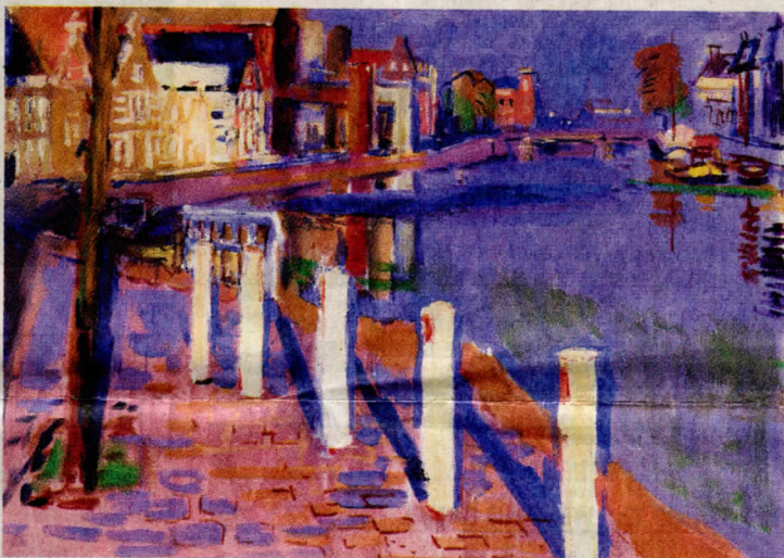
Jan van der Baan – Gezicht op de Noorderhaven.

In het Grafisch Centrum treffen grafici elkaar op de eerste maandag na Driekoningen, alwaar zij het glas heffen en de