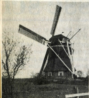
De watermolen van Remmers, later van de Vries. De molen en de onderliggende woning werden omstreeks 1938 afgebroken.