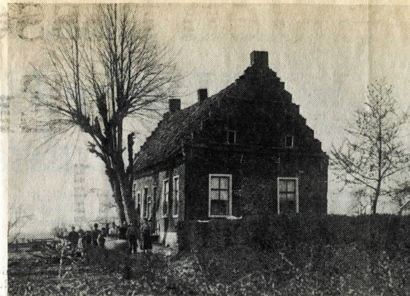
Het oude rechthuis aan de Hoofdweg. Deze woning werd vroeger bewoond door drie gezinnen. (foto uit 1907)