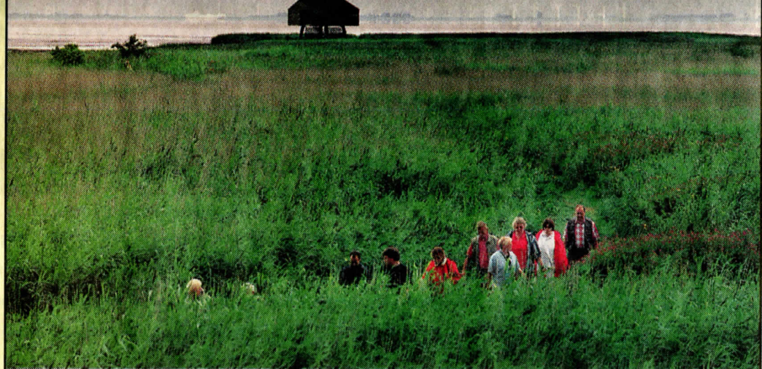
▲ Het Marcelluspad slingert door het riet.