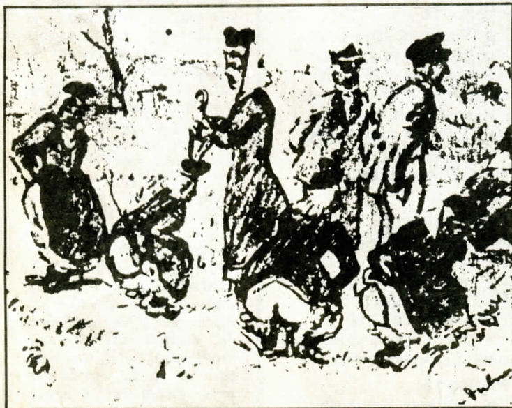
...kerke zugt der nou oet as n ol wief, dij mit rokken omhoog noar weg tou zit... (taikend noar n echt schilderstock van landvolk, dat Van Dulmen Krumpelmann moakt het en in ain van de hörntjes in Hein zien hoese hangt)

Joa, den heur ik ook weer, hou in ain van oorlogsjoareen de kerstkantate opvoerd is. Domie Ader haar hom zulm innander zet. t Was wat nijs en ook omdat domie n man was, dij indruk muik, was kerke tot