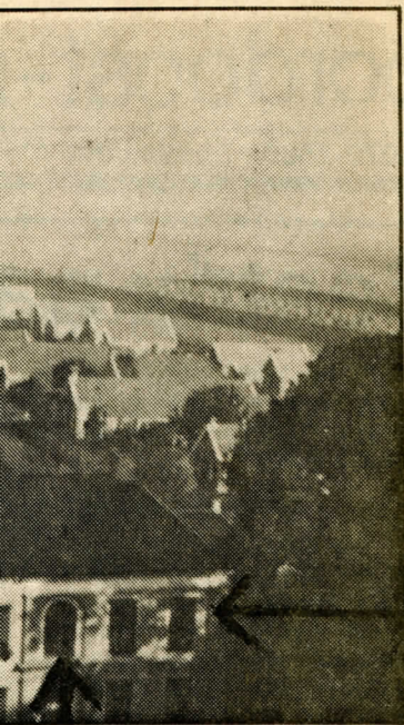
d open gaangdeuren boven zain op was in ringen...

de vraauwlu, dij groaven in onderhold hebben. Nou komt der nog wat: dij kemizzie, dij hailendal oet Fraisland komt, belandt netuurlek in t kefee. Kastelaain kin zoak moaken en breken. Ik zel hem goud induzzelen, dat e ons helpt. Hai mout duchtteg van ons do- mie snaren. Ik wait zeker, dat kastelaain broekbaar wezen