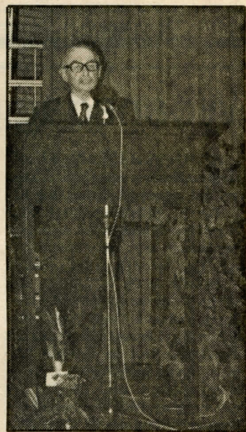
...oetgoan te spreken, veurdroagen oet aigen waark: ieder moal aans...

Ik was weer verbalderd, mor ook blied, dat ik zain loaten kon aan mien luusteroars, dat ik nait logen haar, mor dat