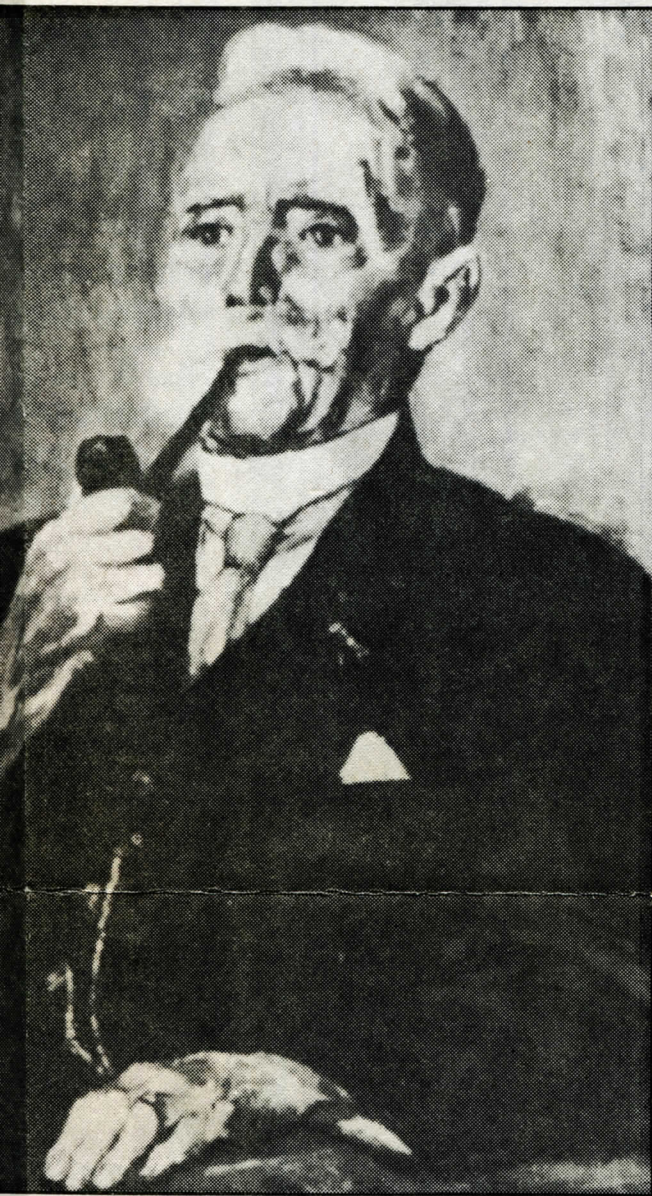
naar een schilderij van J. Altink.