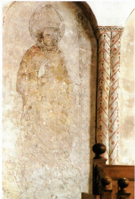
Muurschildering in de NH kerk van 't Zandt

Het rapport gaat niet speciaal over schilderijen. Zij vormen maar één aspect van het monumentenbezit, zij het een aspect, dat naar verhouding weinig aandacht geniet. Als een grote restauratie eenmaal plaatsgevonden heeft, probeert Monumentenzorg nog slechts met minimale middelen hier en daar iets te doen. De dienst is meestal wel op de hoogte van achteruitgang, maar dat wil nog niet zeggen, dat ze in actie komt.