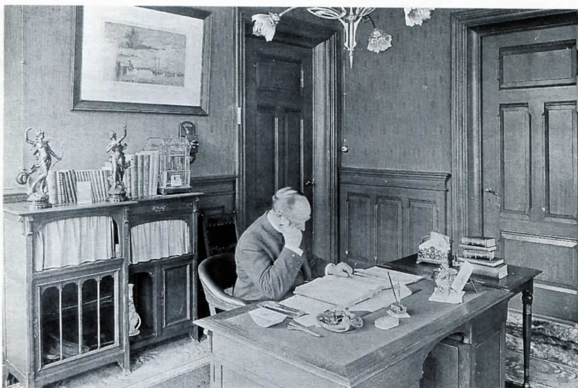
Directiekamer van het Nieuwsblad van het Noorden.

vloeden raden. Of deze, veel losser geschilderde en sterk geabstraheerde tableaus met hun motief van wortelstronken ook naar Bachs ontwerp zijn gemaakt, blijkt niet uit het merk. Het voor een deel ernstig beschadigde tegelfries in dit depot werd op kosten van de NS onlangs zeer zorgvuldig los gezaagd. Gezien de beschadigingen was het niet mogelijk om het tegel'behang' op te nemen in het in het depot geplande reisbureau. Eén deel van het tableau kreeg na restauratie een nieuw museaal leven in het Keramisch Museum Goedewaagen in Nieuw Buinen. Een ander deel is door de NS geschonken aan het Nederlands Tegelmuseum in Otterlo.