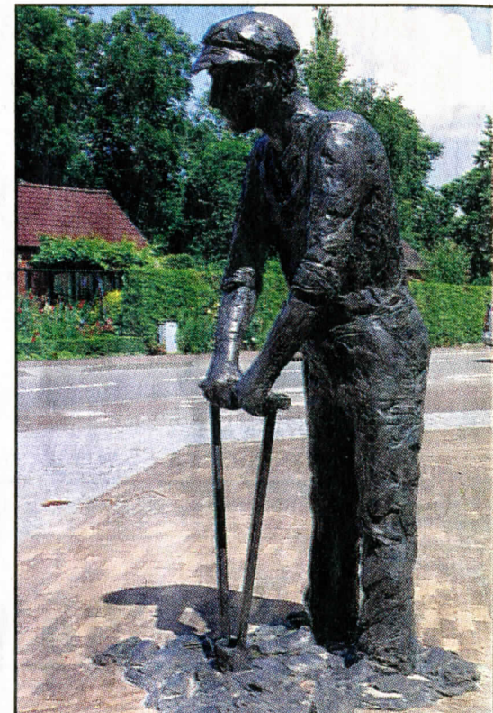
▲ De onlangs onthulde De Landarbeider in Noordbroek.

Plaats: Noordbroek Waarom: Vanuit het dorp vertrokken vanaf deze locatie veel landarbeiders naar hun werk. Dit gebeurde in de vroege ochtend op de fiets. Gemaakt door: Judith Braun. Onthuld: 20 juni 2001.