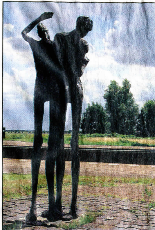
▲ Het herdenkingsmonument langs het spoor in Zuidbroek.

Plaats: Zuidbroek. Waarom: Een herdenking aan de jodentransporten in de Tweede Wereldoorlog die via de spoorlijn door Zuidbroek van het kamp Westerbork naar de vernietigingskampen in Duitsland werden vervoerd. Gemaakt door: Anita Franken. Onthuld: 7 januari 1994.