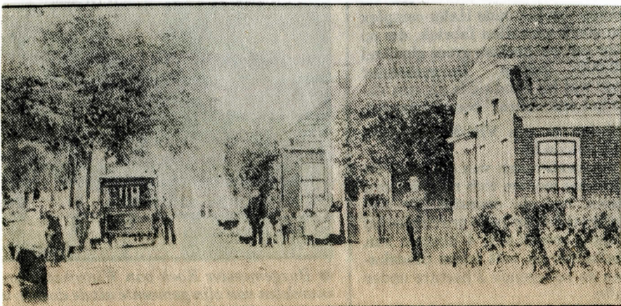
De enige foto van Muntendam (uit ongeveer 1904) waarop de paardetram duidelijk te zien is. De tram reed via Muntendam in de periode van 1881 tot 1911 en werd verzorgd door de Eerste Groninger Tramweg Maatschappij.