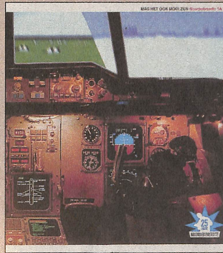
◀ Drie keer Noorderbreedte: Vierkant achter de natuur