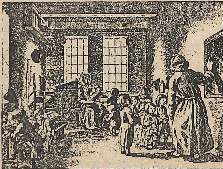
„Cijfermeester, leer de Kunst, hoe men telt in 't kort. Kindren, leert dan hoe een groot uit veel kleintjes wordt.“