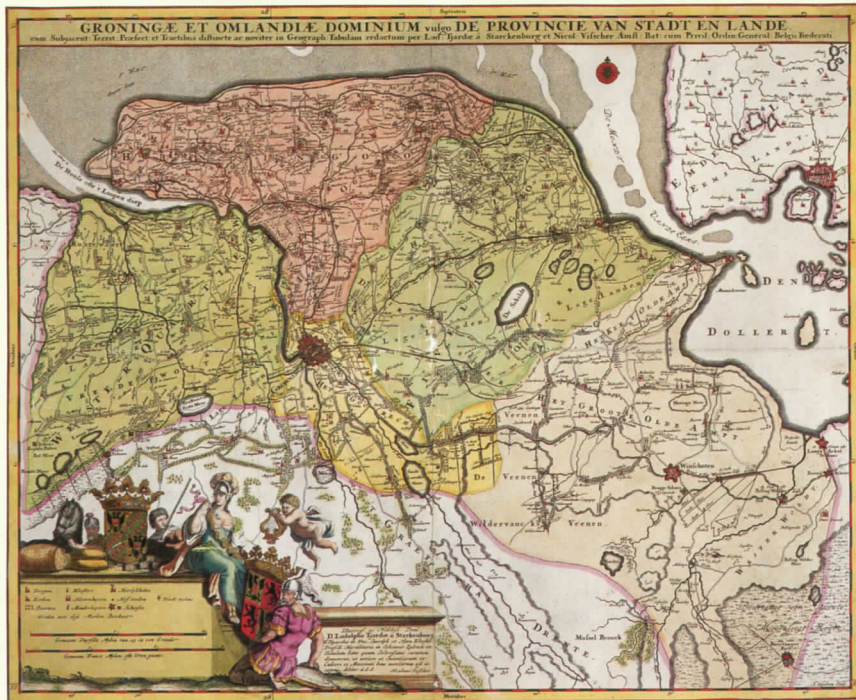
1 Ach Lieve Tijd 2500 jaar Ommelanden

GRATIS dubbelzijdige reproductie bij de fraaie linnen verzamelband