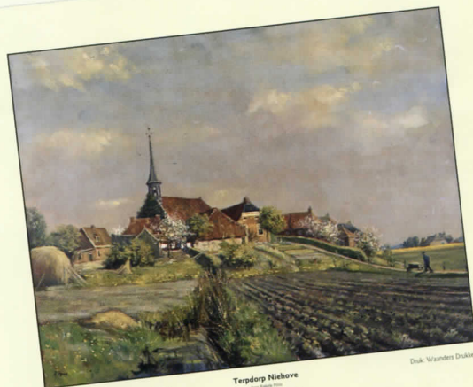
1 Ach Lieve Tijd 2500 jaar Ommelanden

Alle 16 delen van Ach Lieve Tijd zijn te verzamelen in de fraaie linnen verzamelband, zodat een echt boekwerk ontstaat. Koop nu voor slechts € 8,95 de verzamelband en ontvang geheel gratis een fraaie reproductie van de zeventiende-eeuwse kaart 'Groningae et Omlandiae Dominium' van Ludolf Tjarda van Starckenborgh. Op de achterzijde is als extra de schoolplaat 'Terpdorp Niehove' door Riekele Prins afgebeeld. Een mooi cadeau!