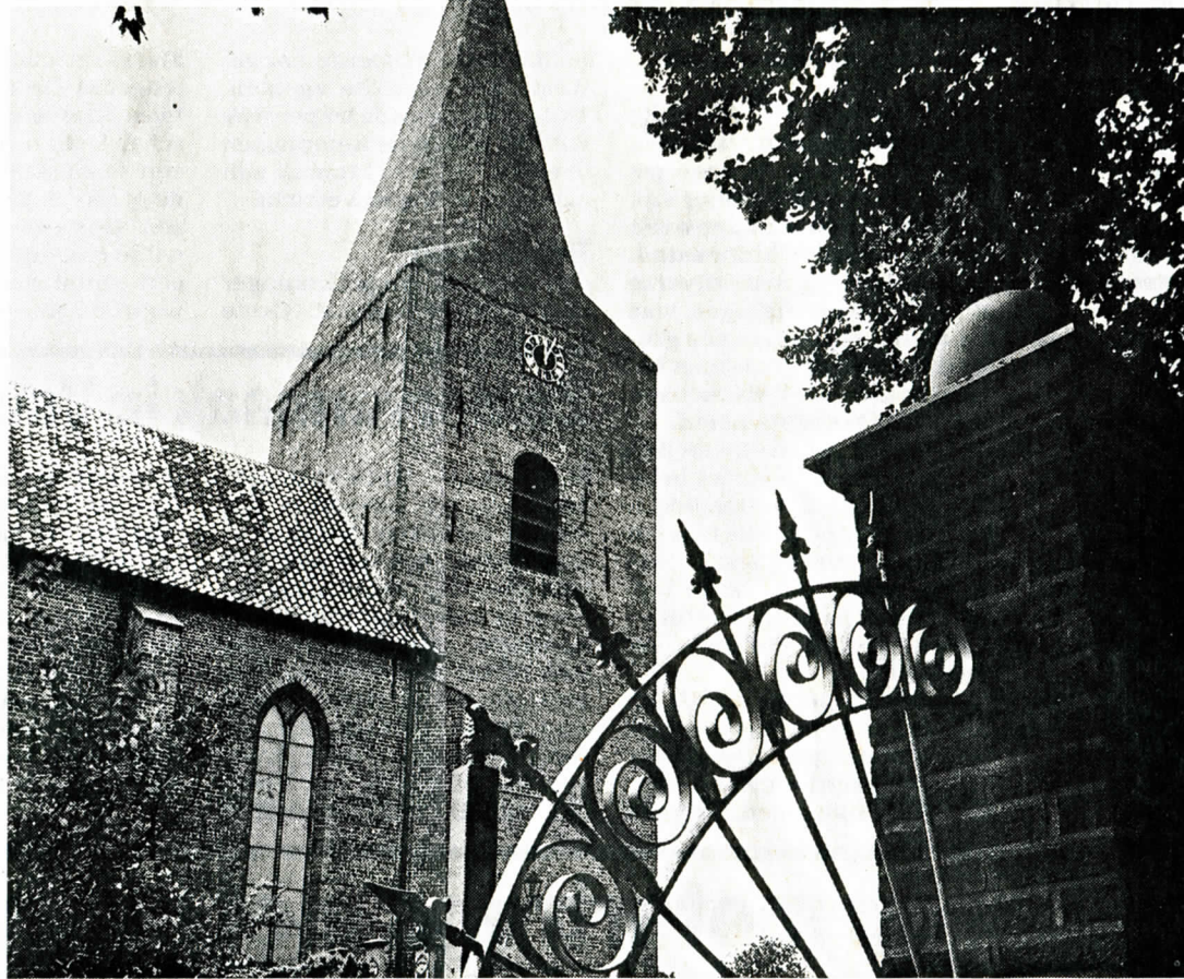
▲ De juffertoren van Onstwedde, nog steeds overeind.

De toren van Holwierde was eeuwenlang een baken voor de scheepvaart. Maar ze werd verwaarloosd: in 1806 was ze zó bouwvallig dat het Rijk besloot, haar te herstellen. (Alle torens waren nu eenmaal rijkseigendom omdat ze in vredetijd de landmeters tot richtpunt en in oorlog de artilleriewaarnemers tot uitkijkpost konden dienen). Van dat voornemen kwam niet veel,