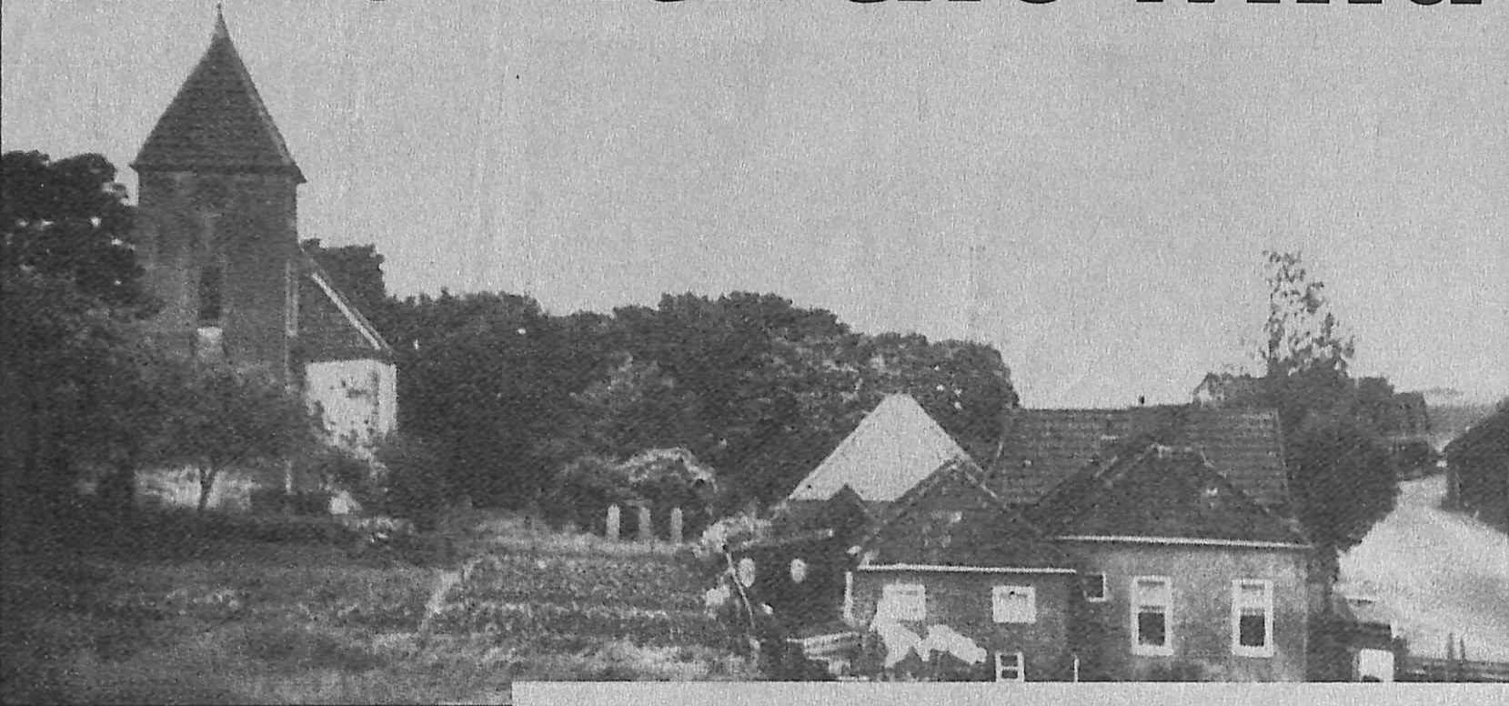
▲ Oterdum, zoals het dorp eeuw in eeuw uit tegen de dijk lag.