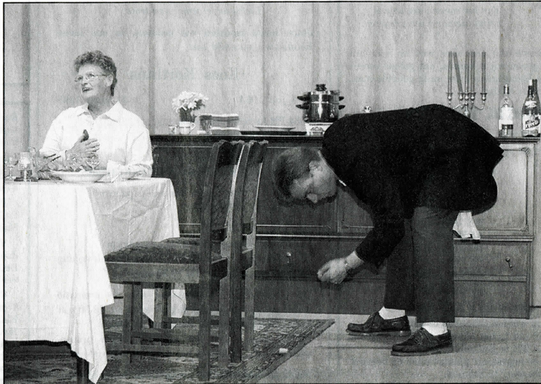
▲ Toneelvereniging Palvu is één van de deelnemers aan het eenakterfestival in Oude Pekela. Het stuk „Feestelijk diner” wordt nog eens goed doorgenomen.

Een van de activiteiten van het GCA is het organiseren van eenakterfestivals. Werden deze festivals voorheen in verschillende weekenden georganiseerd, dit jaar vinden zij alle in hetzelfde weekend plaats. De reden hiervan is om met behulp van geconcentreerde publiciteit een groter deel van de theaterliefhebbers in