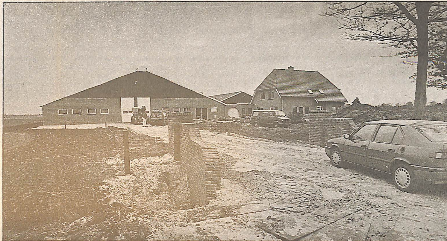
▲ ...en een nieuwe.