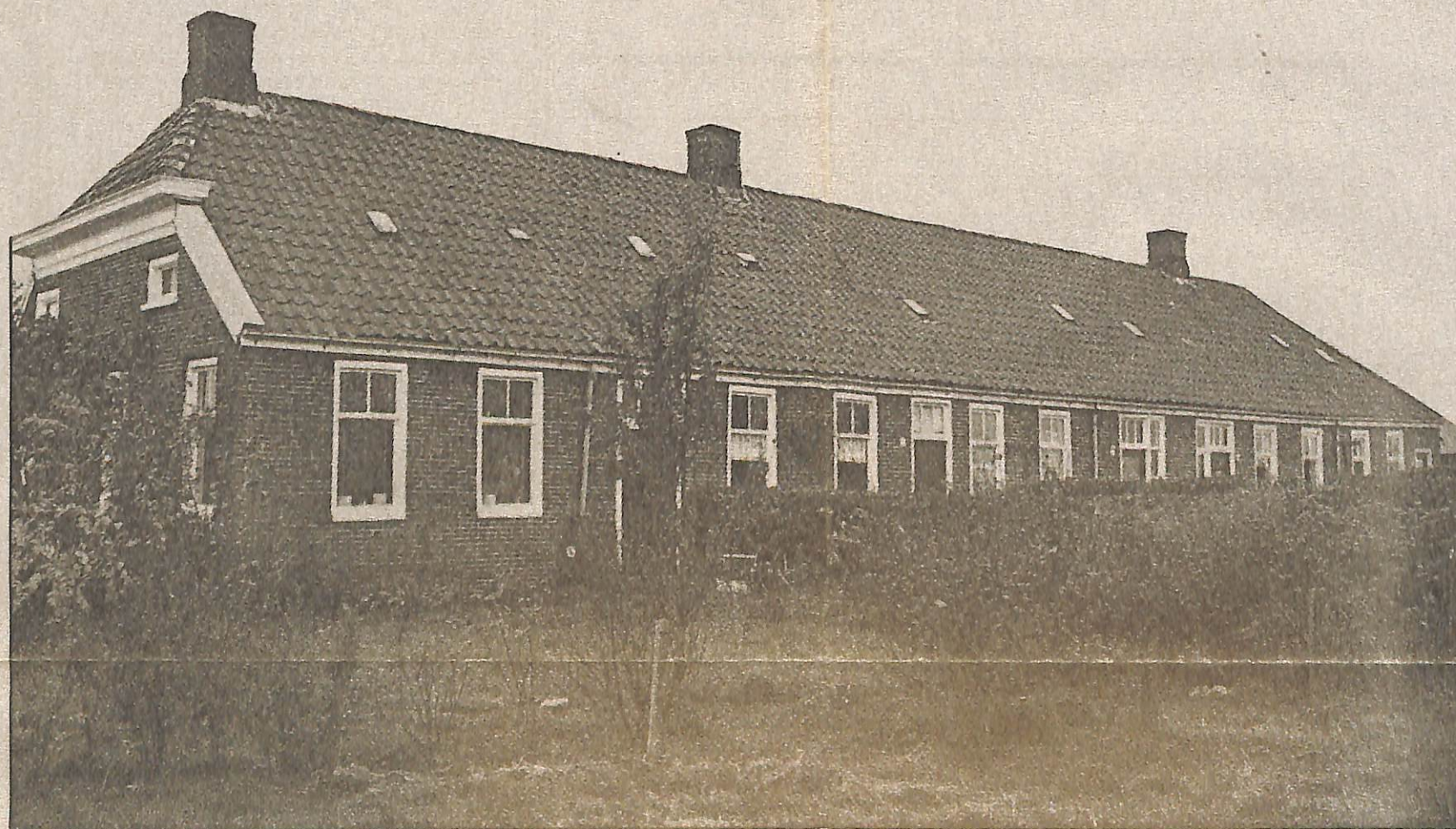
▲ Het armenhuis in Kielwindweer. „We hadden de foto nog maar net gemaakt of toen kwam bij wijze van spreken de sloper er al aan om het af te breken.”