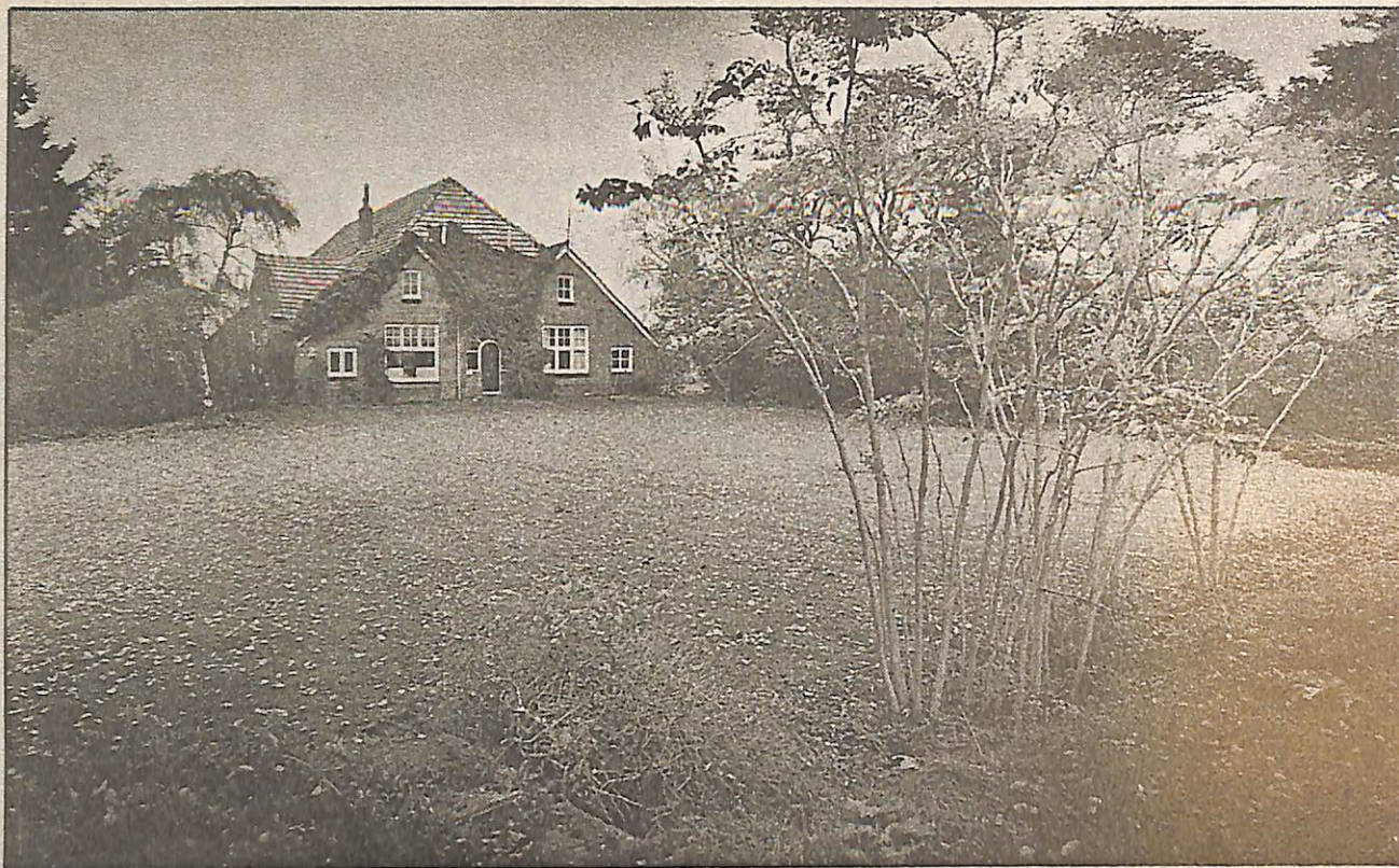
▲ Het Hebrecht, oude boerderij...