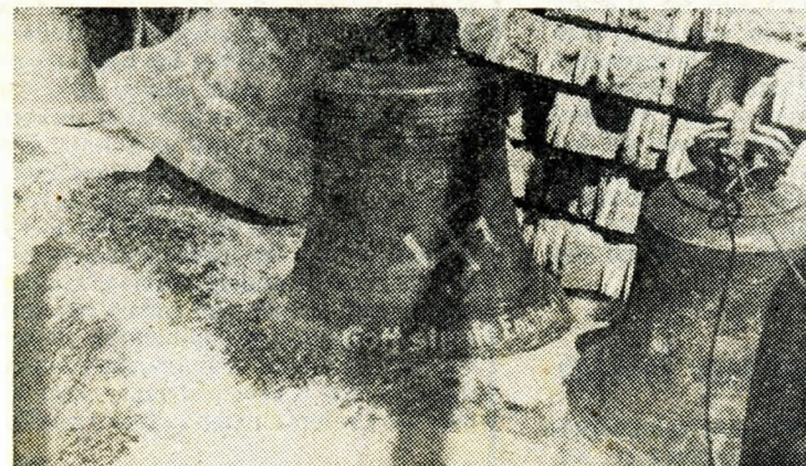
De klokken werden vaak door de Duitsers met leuzen beschil- derd.

Deze derde groep klokken kwam in Groningen terug met twee zeeschepen, „Olwe” en „Sursum Corda”. De klokken werden op 21 november 1945 gelost bij de Herebrug.