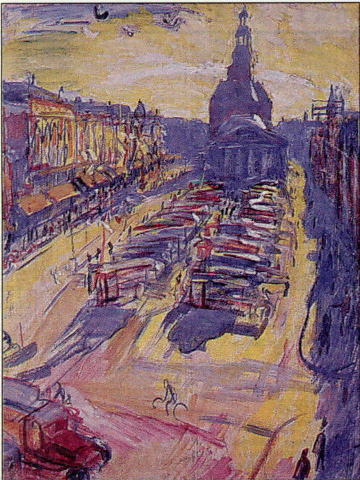
▲ De Vismarkt tussen 1920 en 1930.