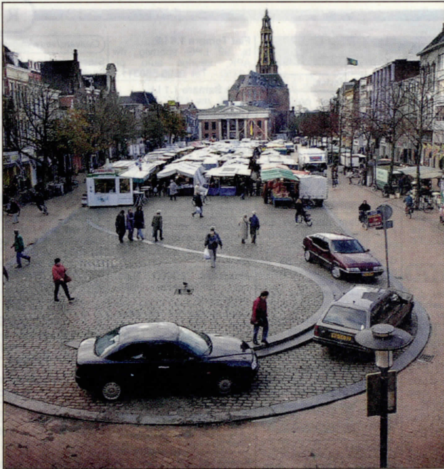
▲ De Vismarkt hedentendage.