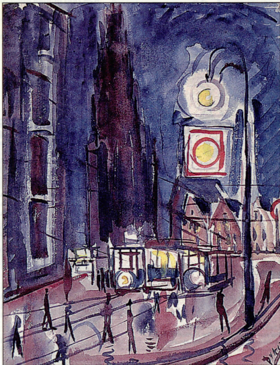
▲ De Grote Markt in 1925 en de Grote Markt in 2000.