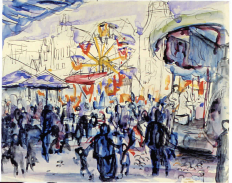
Aquarel 'Kermis Vismarkt'