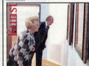
Koninklijke kijk op kunst