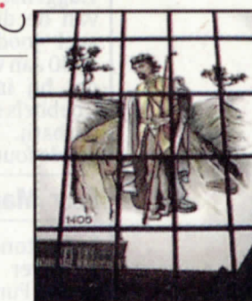
Warm onthaal in Pepergasthuis