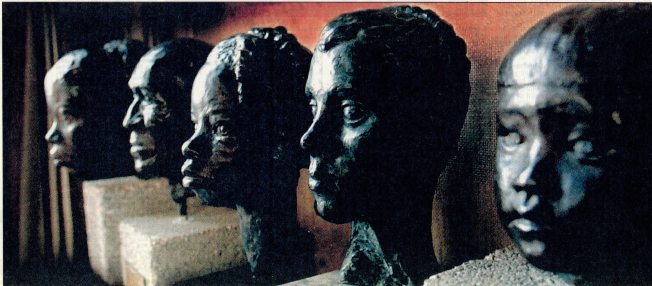
◀ Al vijftig jaar maakt de kunstenaar beelden.

En nu? „Nu is mijn uitgangspunt: Doe je niemand pijn en doe je niemand verdriet? Is het mooi en moet je het vastleggen. Nou, dan moet je het gewoon dóén."