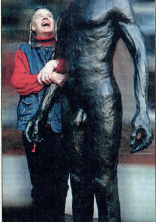
▲ Van de Antilliaanse mannen moest Tula een broek aan, de vrouwen zagen hem liever zonder.