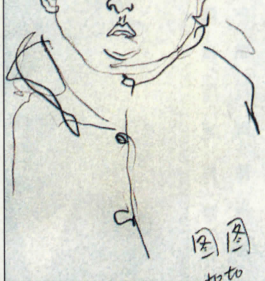
▲ Tekening van een Chinees jongetje.