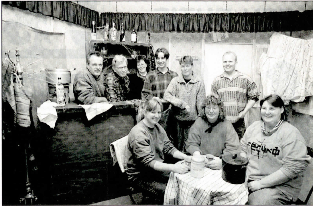
▲ De toneelgroep van O.K.K..