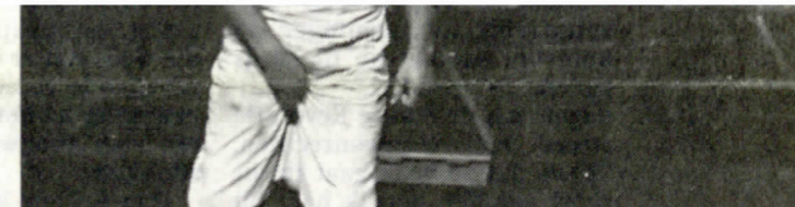
'Verhalen uit het Weense woud', 1993.

Maar een gouden tijd was het, dat wel. De meisjes met het breiwerkje, de jongens die tij-