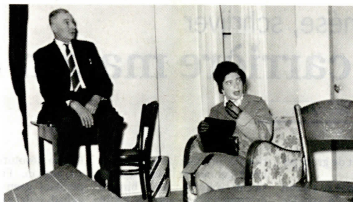
'De vergeten dochter', 1969.