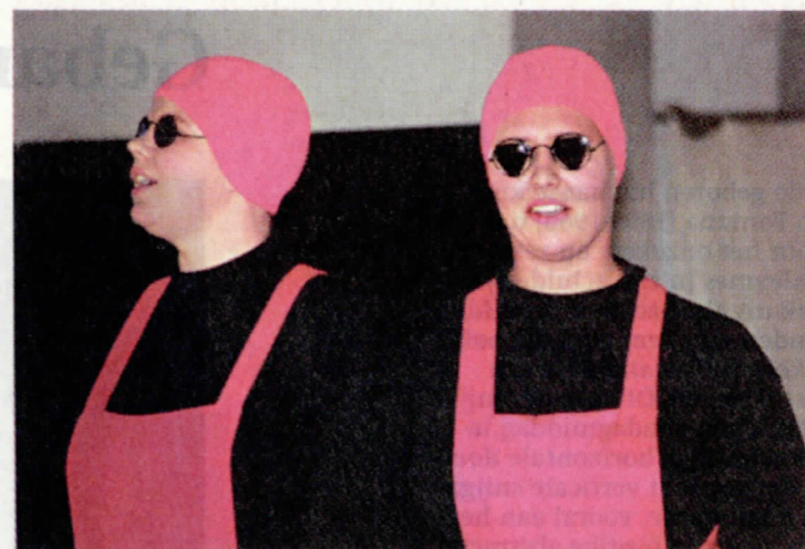
'Het bezoek van de oude dame', 1996.

dens het melken hun tekst leerden. Allemaal lid geworden omdat dat nu eenmaal traditie was.