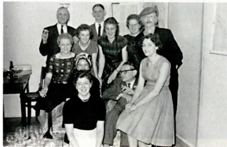
'De ladder Jacobs', 1961.

Hilberdink vertelt het met een brede glimlach om zijn lippen. Genoeg reden voor die glimlach want het IOVIVAT van nu is het IOVIVAT van toen niet meer. De vereniging beschikt tegenwoordig over heel veel spelers, verspreid over een volwassenengroep, een jongerengroep en twee jeugdgroepen. De afgelopen jaren heeft