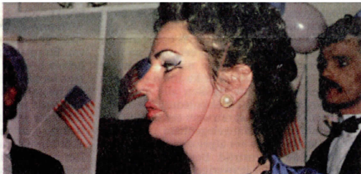
'Alles voor de tuin', 1987.

De notulen uit die beginperiode vormen fascinerende lectuur. De vereniging was er duidelijk ter verheffing van het volk, dus als er met die ideeële doelstelling een loopje genomen wordt is de voorzitter er als de kippen bij om overtreders op de vingers te tikken. Zo lezen we in de notulen van 27 mei 1899 dat 'er door de voorzitter wordt aangemerkt, dat de taal die hier heden avond gesproken wordt verre van