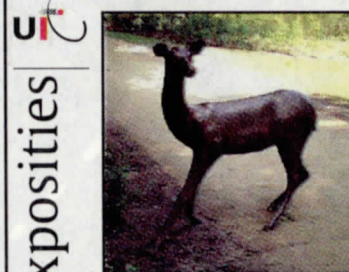
Huilende hinde in Noorderplantsoen