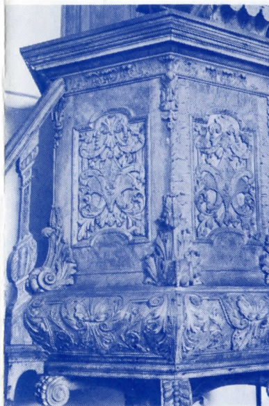
De preekstoel in de kerk van Niebert