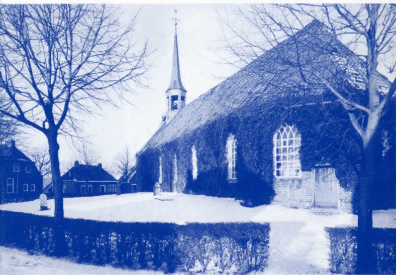
De kerk van Niehove

Al tien jaar bestaat de Stichting Oude Groninger Kerken, die wil redden wat verloren dreigt te gaan. In