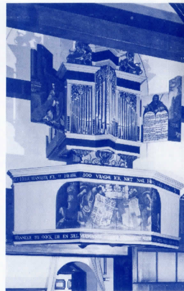
Het orgel in de kerk van Midwolde

die tijd heeft de Stichting meer dan dertig van die kostelijke oude kerken overgenomen. Twaalf ervan werden gerestaureerd. Ze zijn nu weer het centrum van het opbloeiend dorpsleven. Want de dorpen kregen hun hart terug.