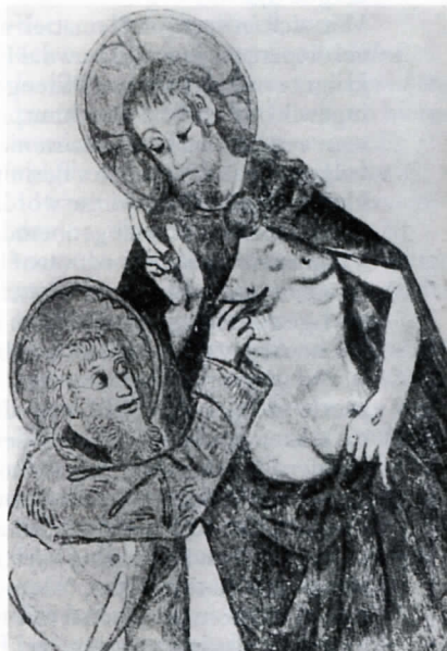
De ongelovige Thomas in de NH Kerk van Loppersum.

Het is een misverstand dat ten tijde van de Reformatie alle kerken hele-