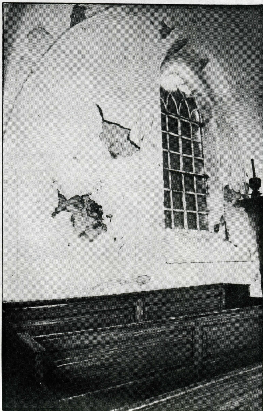
Typerend voor de toestand van veel kerken: zo was die van Godlinze er bij het begin van de restauratie aan toe.

Mijn vakanties breng ik meestal daar door waar een zekere mate van kerkendichtheid bestaat. Aanvankelijk vonden de kinderen dat best leuk, want dan konden ze er doorheen rennen. Ik herinner me allerlei kerken in Engeland waar ze op de preekstoel gingen staan. Later vonden ze het minder aardig. De laatste vijf jaar maken m'n vrouw en ik altijd fietstochten, drie keer richting Duitsland, twee keer richting Engeland. Dan bezoeken we dertig tot zeventig kerken per vakantie.