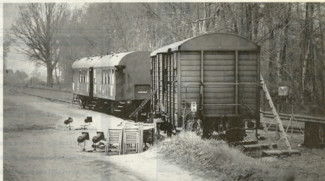
De speelwagon (voor) en de woonwagons van Das Letzte Kleinod.

De Ossetong wordt vanavond om 20.00 uur, za 26 en zo 27 apr. om 16.00 en 20.00 uur opgevoerd bij het station in Stadskanaal; ma 28 en di 30 apr. om 16.00 en 20.00 uur bij het station in Veendam. Reserveren: 0598-616393