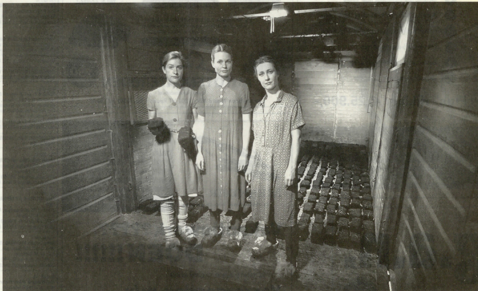
De acteurs van Das Letzte Kleinod in hun speelwagon.

wen die een verhaal vertellen'. Hij bestierde vervolgens een theaterwinkel in De Pijp, maar dat liep niet. "Toen bedachten we dat we iets mobiels wilden doen. Zo kwamen we op het idee van de kunstwagons."