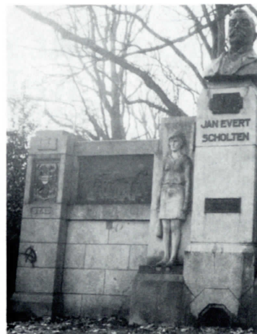
Het Scholten-monument in het Stadspark