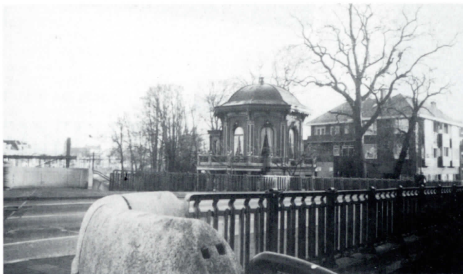
De theekepel bij de Herebrug