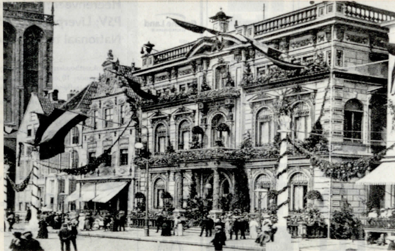
Het Scholtenshuis aan de Grote Markt in Groningen.