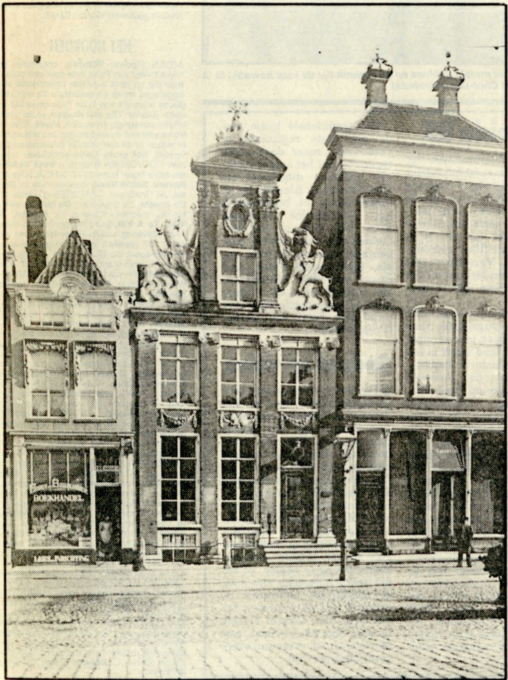
● Links op de foto uit 1901 boekhandel Noording, gelegen aan de noordzijde van de Vismarkt. Op de plaats van de twee linker panden staat tegenwoordig de centrale vestiging van de Openbare Bibliotheek. In het rechterpand zit nu een textielwinkel. Noording is later nog verhuisd naar de Oosterstraat maar is vorig jaar opgeheven.