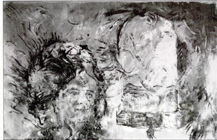
Tonnu Oosterhoff (1953) zelfportret (1972)