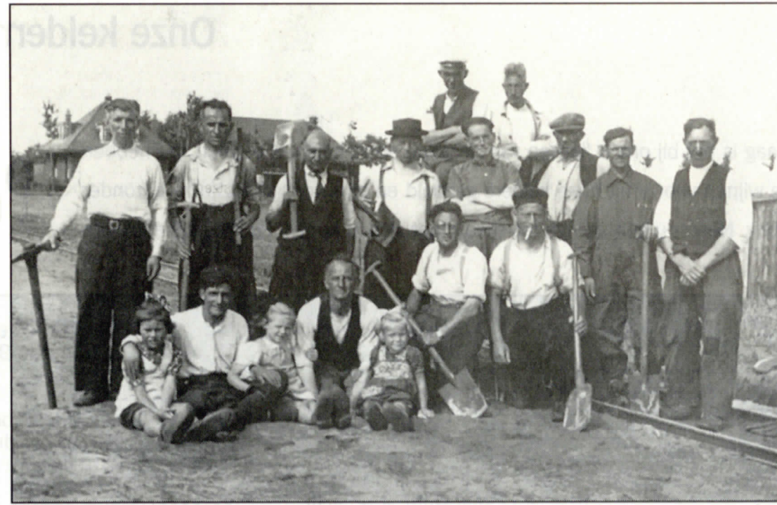
▲ Van 1935 tot 1948 zijn de achttien barakken in Sellingerbeetse gebruikt als werk- en interneringskamp.

Het gedicht geeft aan dat de overlopers na 1945 aan een streng regime werden onderworpen in Sellingerbeetse. Tijdens het laatste deel van de oorlog diende het kamp vooral als uitvalsbasis voor Randstedelijke NSB'ers die via Lunenburg uiteindelijk weer in Nederland belandden. De Duitse grond werd hen te heet onder de voeten toen het Amerikaanse leger steeds verder oprukte. Rob Iepenburg (65) uit Rijswijk zat toen ook in De Beetse. Als kind van 'foute' ou-