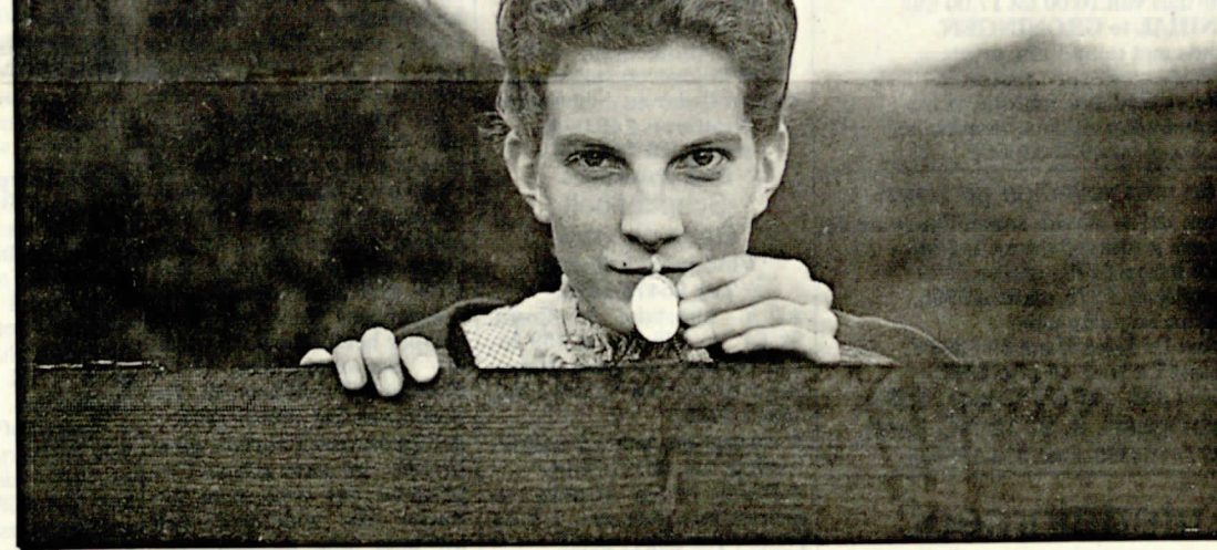
◀ Marloter Riele 'De eeuw List'.

gedonderd mee: ze komen niet opdagen of willen ineens geld. Maar bij Bruin Goud had ik een grote groep trouwe figuranten, die niet begon te zeuren als ze uren moesten wachten in slechte weersomstandigheden. Ook achteraf hoor ik geen geklaag. Bij de montage hebben we sommige scènes weg moeten laten, waarvoor wel tientallen figuranten uren hadden gewerkt. In de aflevering 'Stoom' is dat ook gebeurd. Daar hebben we de slotscène met de figuranten uitgeknipt, omdat het dramatisch gezien sterker was de acteur alleen met die brand te laten zien. Film maken is nu eenmaal veel wachten en later knippen. Achteraf hebben we alle geluid in de studio nog eens moeten nasynchroniseren. De mensen kwamen iedere keer trouw opdagen. Niets was hen te veel.”