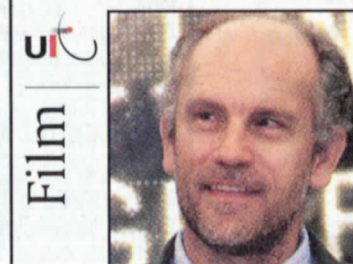
Ik heb weinig met John Malkovich / 35