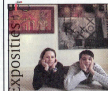
Het moderne gezicht van De Ploeg / 36