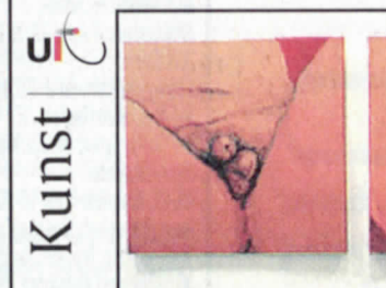
Nieuw poeziefestival in het noorden / 34