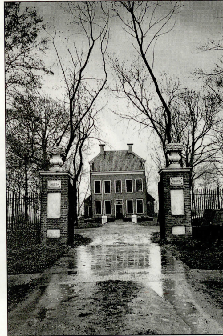
▲ De statige oprijlaan naar de borg Rusthoven (1686). De borg is een 'speeltuin' voor kunstenaars geworden. Binnen en buiten kunnen zij hun gang gaan en kneden de omgeving zo naar hun hand.

Hun kunstwerken geven het landschap mede vorm. Landschap en borg voeden elkaar ook en daarom noemde zij haar eerste expositie in 1993 'Sculptuur