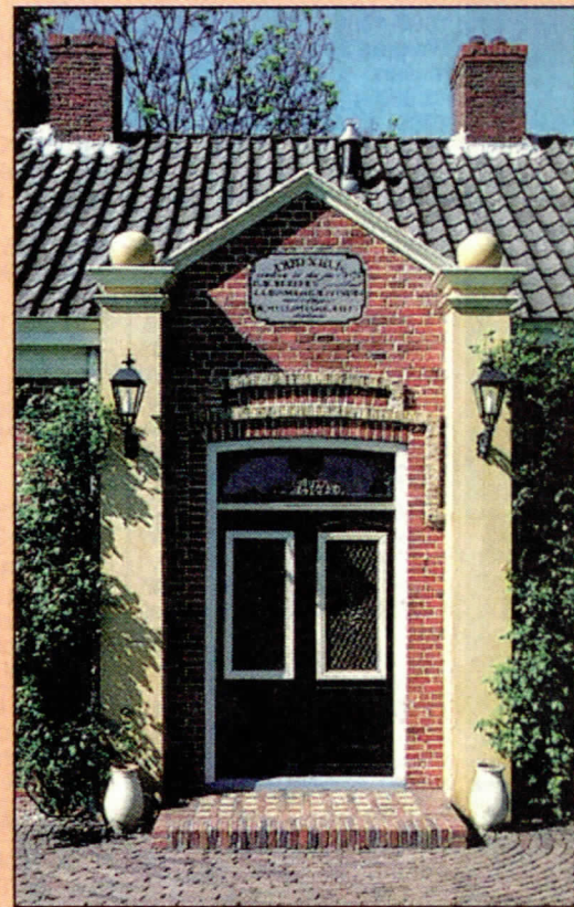
▲ De gevelsteen met de namen van de bestuurderen. Bij toeval vond Woldring die steen terug onder vloer van het toneel van het jeugdgebouwtje bij de kerk.

Aan de achterzijde van de woonvertrekken bewaarde hij van de vijf aanrechtkastjes er