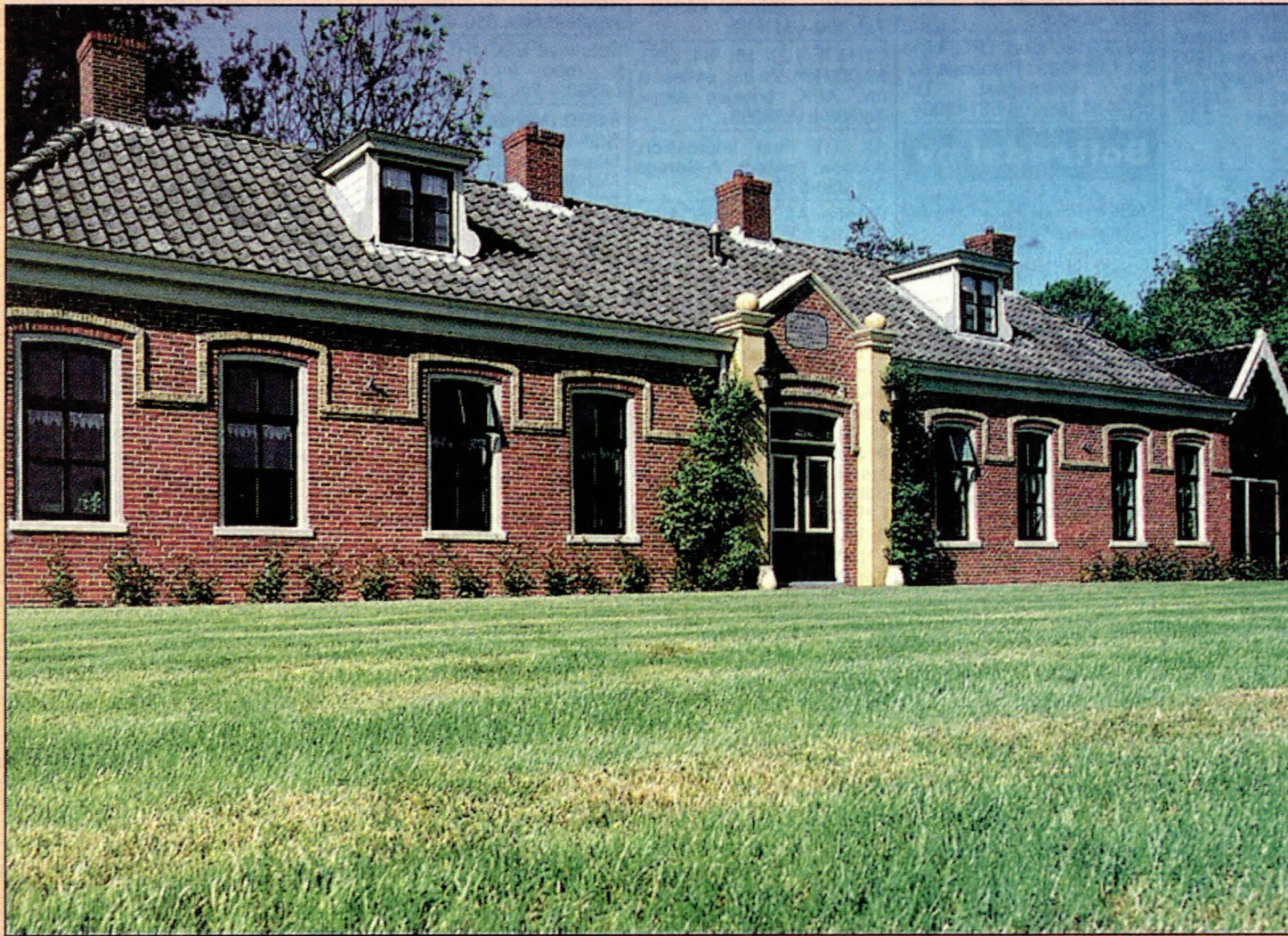
▲ Het Armenhuis 'uit den jare 1873' prijkt als een sieraad in het landschap van Tjamsweer bij Appingedam. Links de woonkamer en uiterst rechts 'de stille knip' waar eens in de maand de twaalf gezinnen van de buurtschap gezellig bijeenkomen.

Tjamsweer – Zijn vader had hem nog zo gewaarschuwd. „Je moet wel je best doen op school, anders kom je nog in het armenhuis terecht.” Een profeet, die ouwe van hem, want zie, het jochie, dat in de klas te veel uit het raam keek en mooie dromen droomde, belandde inderdaad in een armenhuis. Maar niet als armoedzaaier, maar als 'Heer van Tjamsweer'. Zijn 'kasteeltje' langs de weg Delfzijl-Groningen springt al van verre in het oog.